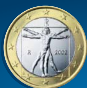
L'"UOMO VITRUVIANO" DI LEONARDO DA VINCI