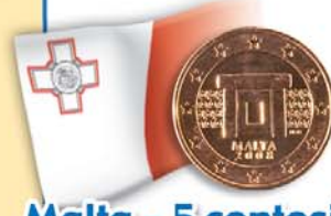
Malta - 5 centesimi Altare del tempio preistorico