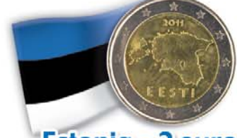
Estonia - 2 euro Immagine geografica del paese