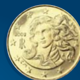
PARTICOLARE DELLA "NASCITA DI VENERE" DI SANDRO BOTTICELLI