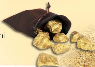
L'oro in polvere o pepite: era una forma diffusa di moneta merce