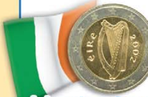
Irlanda - 2 euro Arpa celtica