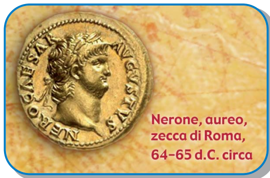
Nerone, aureo, zecca di Roma, 64-65 d.C. circa

Con questa garanzia tutti accettavano quella moneta e ne diffondevano la circolazione. Nel corso della storia, i sovrani hanno spesso impiegato una quantità di metallo nobile inferiore al valore riportato sulla moneta, poiché ne trattenevano una parte come imposta sulla coniazione ("signoraggio"). Inoltre, quando le casse dello Stato erano vuote, i sovrani coniarono moneta con una quantità di metallo nobile inferiore e un'aggiunta di metallo "vile". Chi possedeva delle monete aveva comunque la certezza che lo Stato non le avrebbe rifiutate.