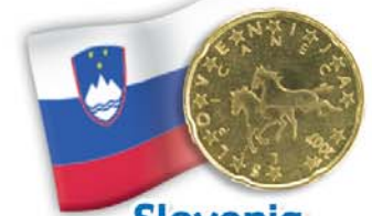
Slovenia 20 centesimi Cavalli lipizzani