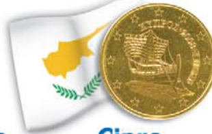
Cipro 50 centesimi Nave mercantile