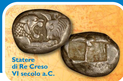
Stateres di Re Creso VI secolo a.C.

I metalli preziosi si dimostrarono particolarmente adatti a essere utilizzati come moneta merce; erano abbastanza rari e ampiamente apprezzati per la loro bellezza e duttilità; resistevano alla corrosione e mantenevano inalterato nel tempo il loro aspetto e la loro qualità; concentravano molto valore in poco spazio, erano divisibili in pezzi di grandezze diverse . In questo modo era possibile raggiungere con precisione il valore della merce da acquistare.