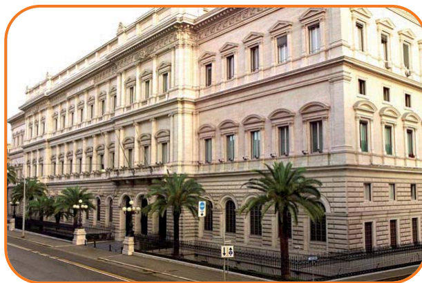
Roma, Palazzo Koch, sede della Banca d'Italia

Il disordine causato dall'esistenza di più banche di emissione spinse gli Stati ad affidare il compito di emettere banconote a una sola banca. In tal modo gli Stati potevano meglio esercitare il controllo e garantire la sicurezza. Questa banca in ogni Stato venne chiamata "centrale".