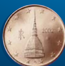
LA MOLE ANTONELLIANA