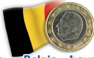
Belgio - 1 euro Re Alberto II