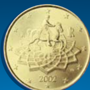
MONUMENTO EQUESTRE DELL'IMPERATORE MARCO AURELIO