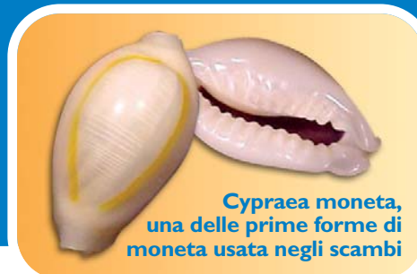
Cypraea moneta, una delle prime forme di moneta usata negli scambi

La moneta merce svolgeva le tre funzioni tipiche della moneta: pagare, misurare, conservare un valore nel tempo.