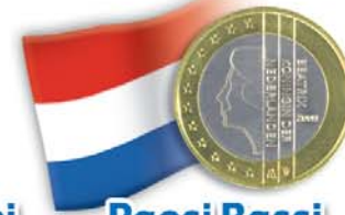
Paesi Bassi 1 euro Regina Beatrice