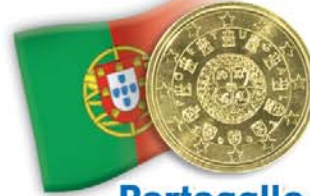
Portogallo 50 centesimi Sigillo del primo re di Portogallo (1142)