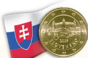
Slovacchia 50 centesimi Castello di Bratislava