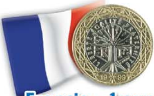
Francia - 1 euro Albero della vita