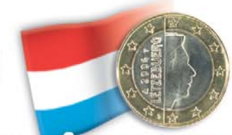
Lussemburgo 1 euro Granduca Enrico