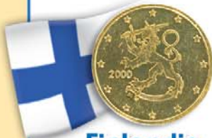
Finlandia 50 centesimi Leone araldico