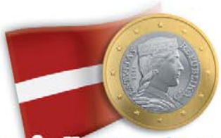
Lettonia - 1 euro Ritratto di ragazza lettone