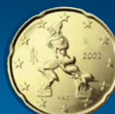
SCULTURA DI UMBERTO BOCCIONI