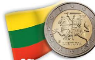
Lituania - 2 euro Vytaitis, il cavaliere d'argento