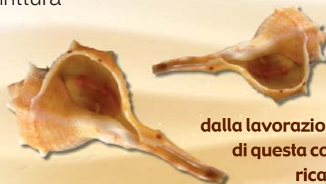
Il murice: dalla lavorazione del mollusco di questa conchiglia veniva ricavata la porpora