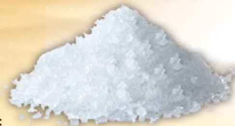
Il sale: era una merce particolarmente apprezzata in tutti gli scambi