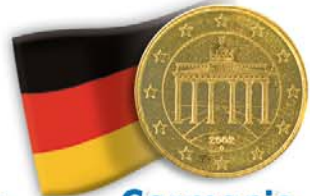
Germania 50 centesimi Porta di Brandeburgo