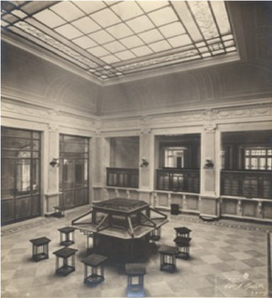
Edificio della succursale di Macerata. Salone aperto al pubblico. Prima metà anni Trenta.

Questa categoria comprende una parte di rilievo dell'Archivio fotografico con più di 3000 immagini per un periodo che va dalla fine degli anni '20 agli anni '80.