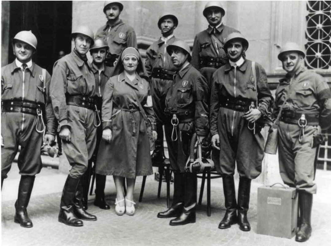
Roma, 22 agosto 1940 - I componenti della squadra di I° intervento della succursale di Roma – (Provenienza: Asbi, Banca d'Italia, Segreteria Particolare, pratt., n.288. fasc.2)

Sono pochissime le immagini che ci restituiscono il lavoro svolto dagli impiegati presso l'Istituto e sempre per contesti non usuali. Tra queste alcune sono contenute in un album con allegato un documento che descrive l'attività e il funzionamento dei Magazzini Generali di Tripoli del 1932; altre provengono dalle filiali coloniali della Banca d'Italia e mostrano i saloni aperti al pubblico in attività. La presenza di fotografie di impiegati dell'Istituto presso le filiali d'oltremare è connesso, secondo l'interpretazione prevalente, alla necessità di colmare una distanza e di restituire in modo tangibile la differenza dei luoghi di lavoro e delle condizioni di vita degli impiegati. Esiguo è il numero di immagini per le filiali in Italia dove sono ritratti i dipendenti sul luogo di lavoro. Per le strutture dell'Amministrazione centrale la fotografia privilegia attività molto specifiche e di carattere non amministrativo (Officine carte valori, Centro elettronico).