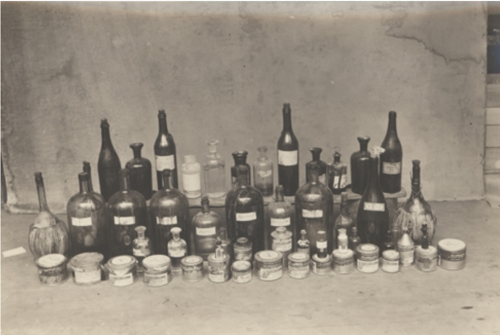
Solventi, colori e inchiostri utilizzati per la falsificazione dei biglietti, 1928-1929 ca. (Provenienza: Asbi, Banca d'Italia, Segretariato, pratt. n. 866, fasc. 4)

Le immagini contenute in questa sezione fanno parte soprattutto dei dossiers di rilievi tecnici effettuati dalle Questure in occasione della scoperta di laboratori di falsari. Le immagini testimoniano le tecniche e i materiali utilizzati per la contraffazione, i falsari, i biglietti e in alcuni casi le monete contraffatte. Le prime immagini sono della fine degli anni '20; la documentazione fotografica presenta una lacuna per gli anni '30/40 e riprende nel dopoguerra sino agli anni '60. Sono all'incirca 250/300 immagini. Da segnalare un esiguo numero di foto relative alla contraffazione di Amlire nel 1948.