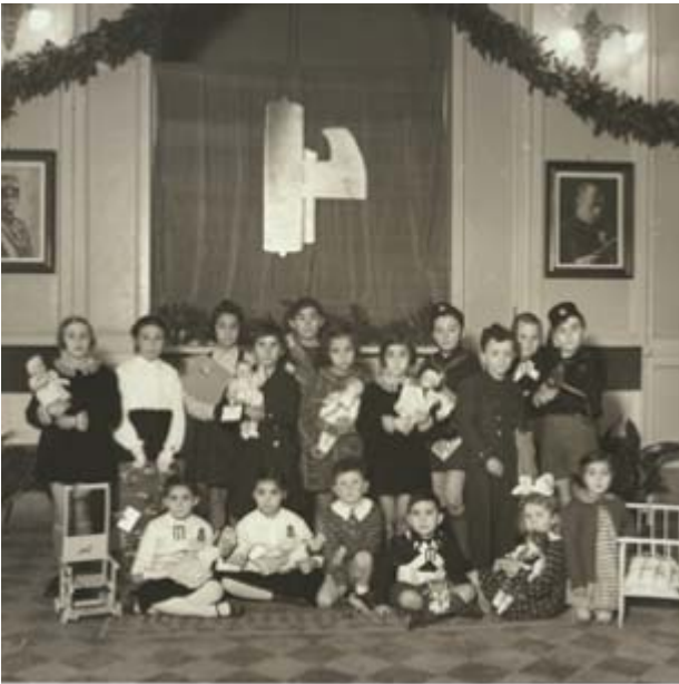
Banca d'Italia. Succursale di Ascoli Piceno. Quinta Befana fascista. Anno 1940 – XVIII (Provenienza: Asbi, Banca d'Italia, Segreteria particolare, pratt., n. 272, fasc. 2)

Per l'attività dopolavoristica presso l'Istituto si segnalano le foto di scena delle commedie organizzate dai dipendenti nel 1939 e realizzate dal fotografo Libero Piermattei; si tratta di circa una quarantina di foto raccolte in album in bianco e nero.