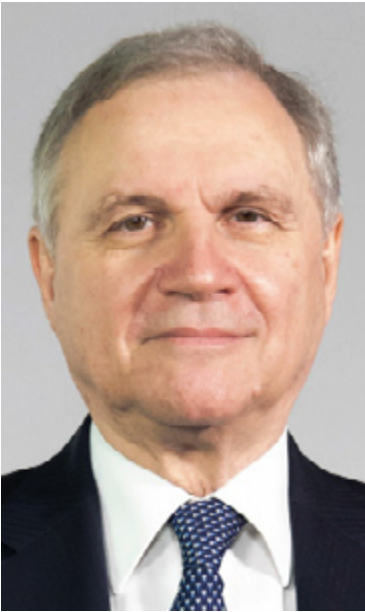
Ignazio Visco Governatore della Banca d'Italia

Le tensioni internazionali derivanti dall'aggressione della Russia all'Ucraina hanno reso meno favorevoli e nitide le prospettive dell'economia, accrescendo le sfide della politica economica anche in un paese come l'Italia, messo in difficoltà dalla crisi pandemica e già da prima oberato da due decenni di crescita insoddisfacente e da un elevato livello di debito pubblico.